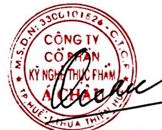
Trần Hồng Quân Chủ tịch Hội đồng quản trị Huế, ngày 04/03/2023